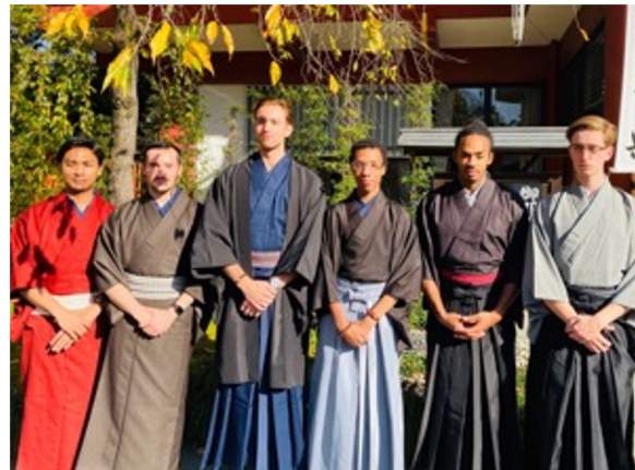
コンテンツ企画・造成