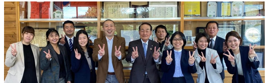
【 孺恋村 熊川村長様 】