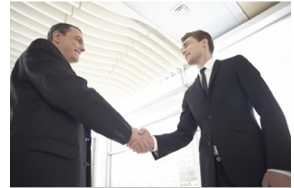
海外商談会向けサポート