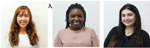
様々な国出身外国人講師陣がふれあい、子どもたちと過ごします

小さい頃から様々な地域・言語、価値観等に触れることによって、 英語で学童の環境内で、グローバル感覚を自然に体感！