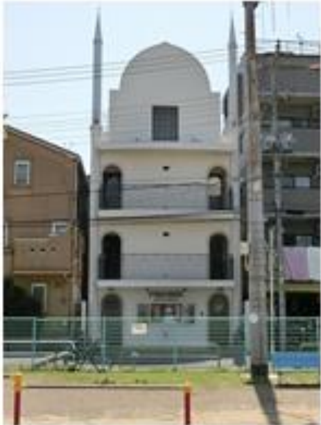
行徳ヒラー・マスジド